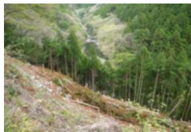
【奥多摩町・むかし道】