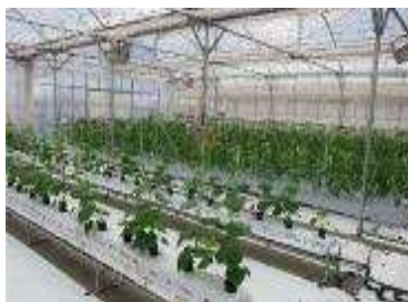
高収益農業の研修施設